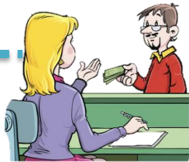
ยื่นเอกสารค่าใช้จ่าย