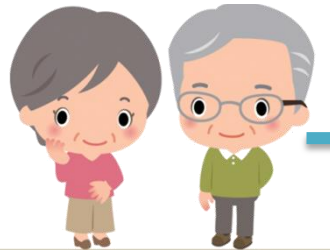
ผู้สูงอายุ