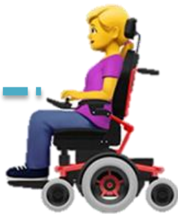
ผู้พิการ