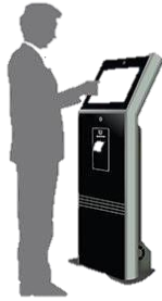
กดบัตรคิว