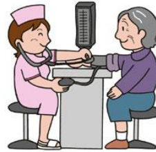
พบพยาบาล คัดกรองรังสีรักษา