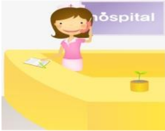
ติดต่อจุดคัดกรอง ศูนย์ส่งต่อ