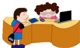
ตรวจสอบสิทธิ์ ในการรักษา