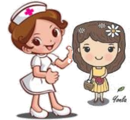
พบพยาบาลรับคำแนะนำ / ใบนัดและกลับบ้าน