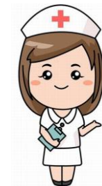
เปลี่ยนไข้ให้พยาบาล ฉายรังสี 2 มิติ