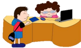
ตรวจสอบสิทธิ์ ในการรักษา