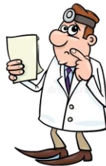
คำนวณปริมาณรังสี