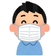
ผู้ป่วยมีนัด ฉายรังสี