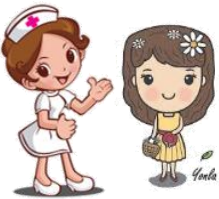
พบพยาบาล CT SIM รับคำแนะนำ และนัดทำ SHIFT ISO