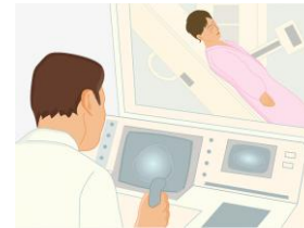
ส่งห้องจำลองรังสีรักษา ฉายรังสี 2 มิติ